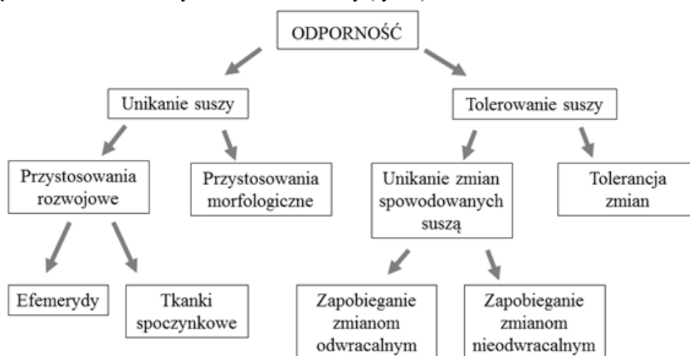
Rys. 2. Odporność roślin na stres środowiskowy (wg Levitt, 1972; za Starck, 2002 zmodyfikowane) Fig. 2. Resistance of plants to environmental stress (according to Levitt, 1972; Starck 2002, modified)

Rośliny wykształciły różne strategie reagowania na suszę, wśród których podstawowe są dwie: unikania suszy i tolerowania suszy (rys. 2).